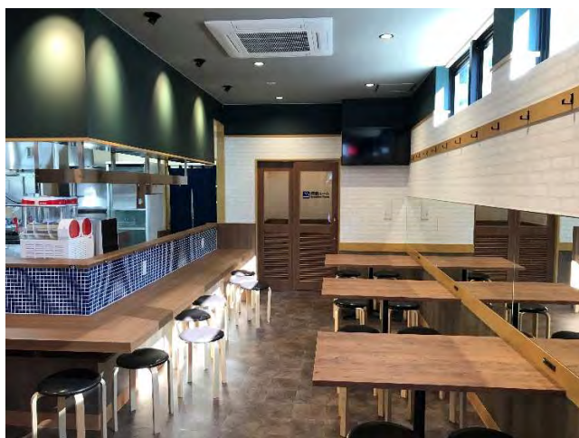
喫煙室側カウンター