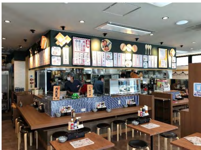
オープン時入口より