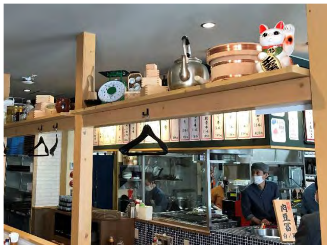
オープン時焼き物側