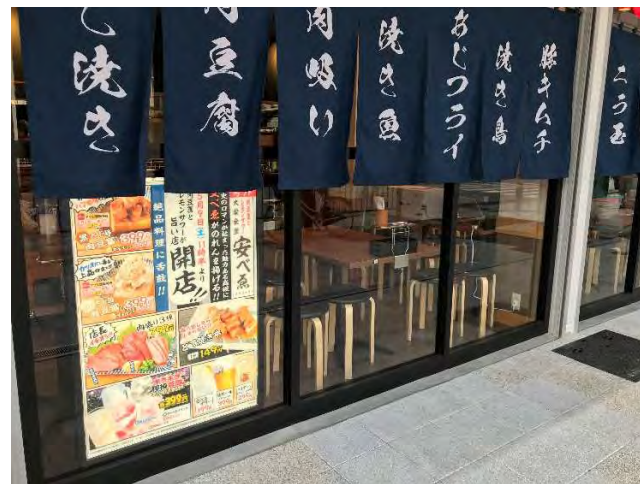
LEDポスターグリップ