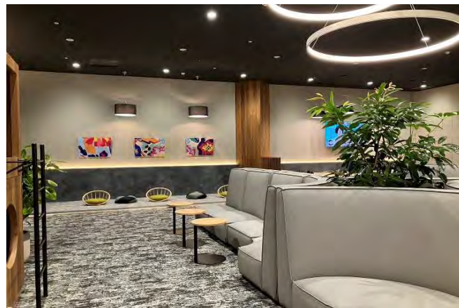
従業員休憩室ソファースペース▲