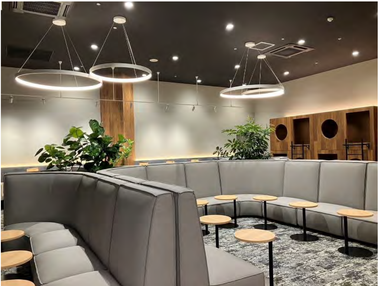
従業員休憩室全体▲

工期 2024年8月6日～9月27日 延べ52日間 利用開始 2024年9月27日