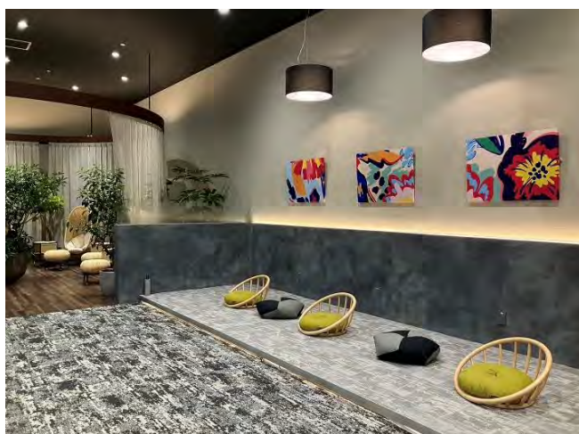
従業員休憩室内小上スペース▲