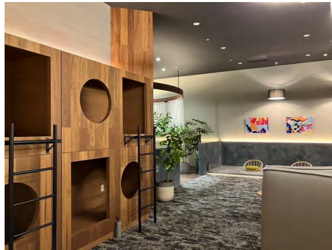
従業員休憩室寝ころびスペース▲