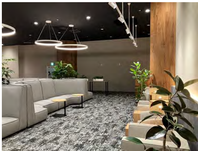
従業員休憩室ソファースペース▲