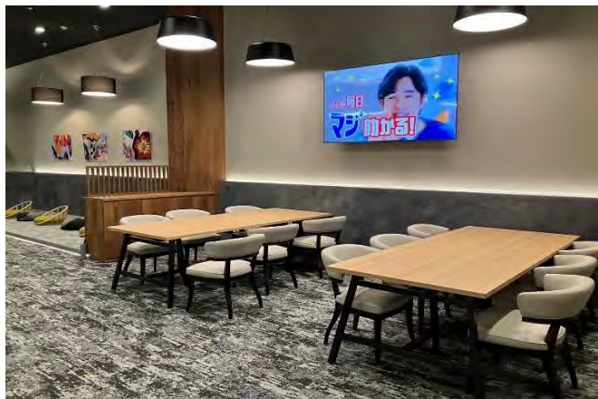
従業員休憩室デスクスペース▲