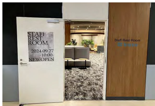
従業員休憩室内出入口▲