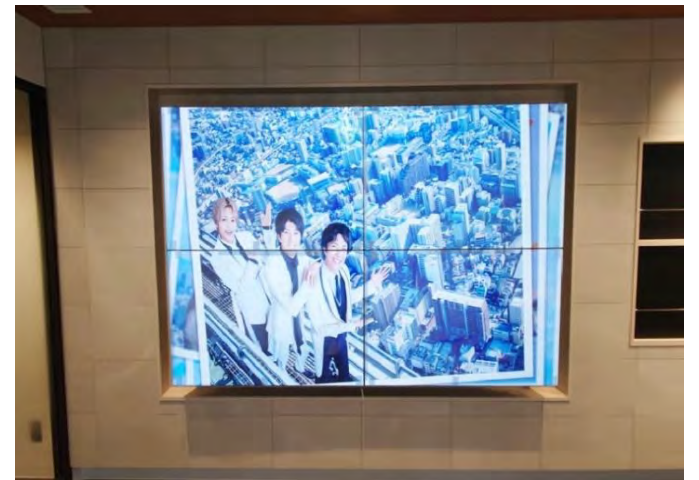
エントランス四面モニター▲