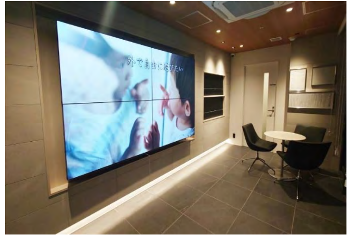
エントランス北側▲