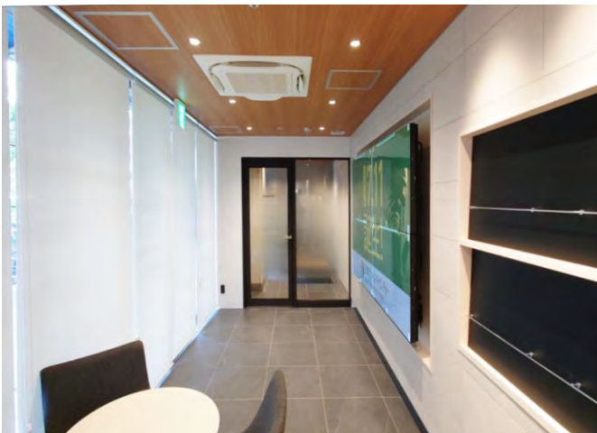
エントランス北側▲